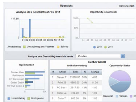
Abbildung 2: vorkonfigurierte Berichtsauszüge aus SAP Crystal Reports in SAP Business One

Geschäftsreisen unabhängig von Netzwerkverbindungen.